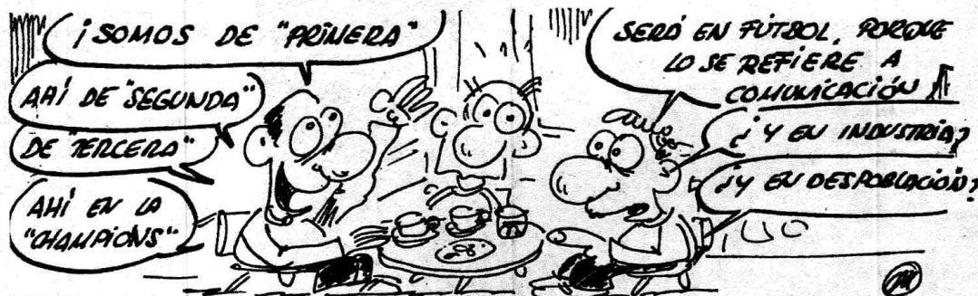
VOX POPULI SORIANA